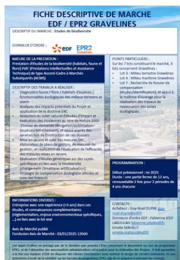
Exemple de Fiche Marché