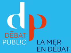
Table ronde « Biodiversit  & Paysages » Golfe Normand Breton